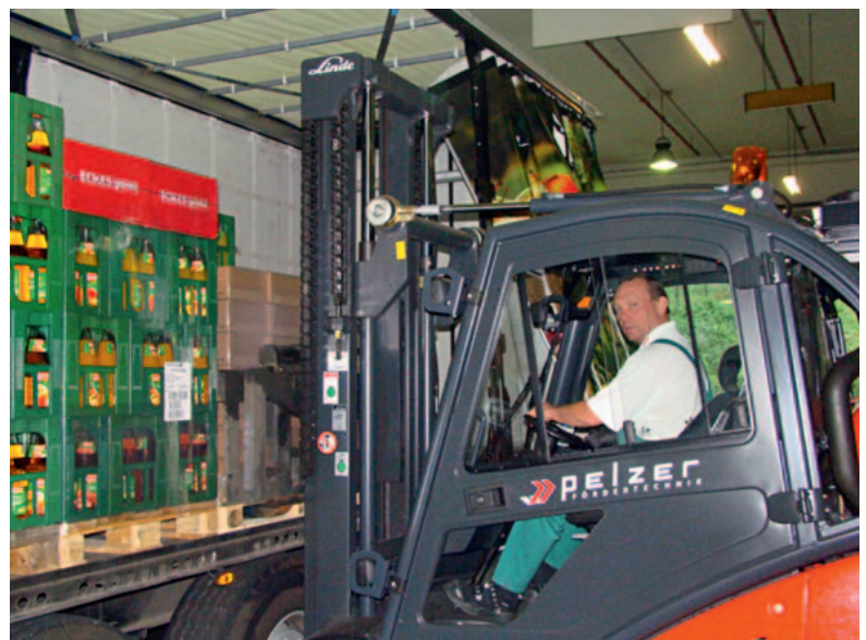
Der Spediteur kann online ein Zeitfenster für die Beladung buchen.

Er sieht jedoch weiteres Verbesserungspotenzial: „Leider geht es nicht bei allen Unternehmen so reibungslos. Deshalb sind wir in einer Zwickmühle: Stehen wir an der vorhergehenden Station vier statt einer Stunde, können wir das Zeitfenster bei Eckes-Granini nicht einhalten. Planen wir einen großzügigen Puffer ein, ist es für uns nicht mehr wirtschaftlich.“ Auch sind die Anlieferzeiten bei den Kunden in der Regel nicht auf die Beladezeit bei Eckes-Granini abgestimmt. Deshalb wünscht er sich für die Zukunft „ein System, in dem die Unternehmen einen