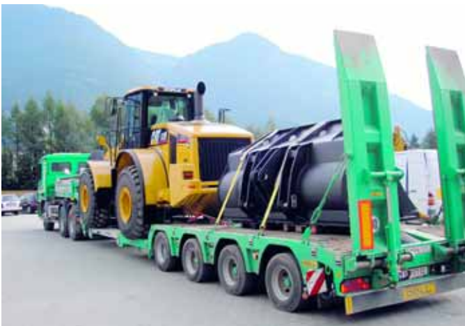
FAST NOCH NORMAL: Der Transport eines Radladers mit der entsprechenden Verladeschaukel.

„Auswertungen im Rahmen einer Diplomarbeit in unserem Haus haben ergeben, dass die Einsparungen bei den Frachtraten im Fernverkehr 10 und 20 Prozent erreichen können“, so der Logistics Manager der ZBM. „In der Administration, also Auftrag ausschreiben, Angebote einholen, Auftragsdaten übermitteln und so weiter, konnte der Aufwand um etwa 20 Prozent reduziert werden.“ Über das Reporting-Modul der Transporeon-Plattform untersucht das Unternehmen zurzeit, wie sich die Logistik noch weiter optimieren lässt.