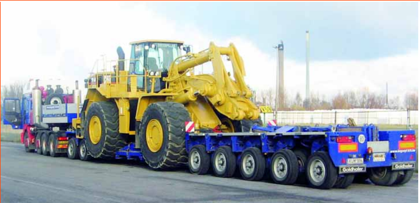
DISPOTIVER AUFWAND: Derart große Transporte erfordern durch Streckenbegrenzungen eine fundierte Planung.